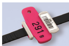
バーコードタイプ