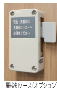
扉検知ケース(オプション)