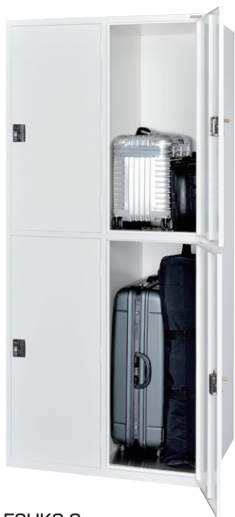
ESUK2-2 (スーツケースロッカー 2列2段 4口用)