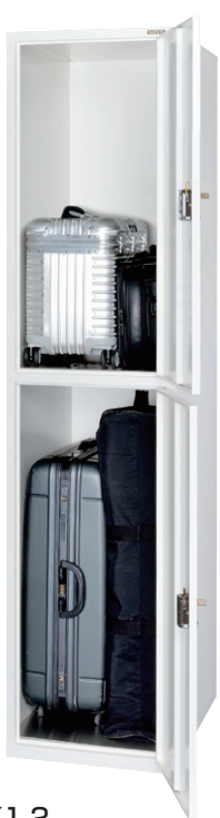
ESUK1-2 (スーツケースロッカー 1列2段 2口用)

各種とも1列タイプもご用意し、スペースや用途に応じた組み合わせにてご利用できます。