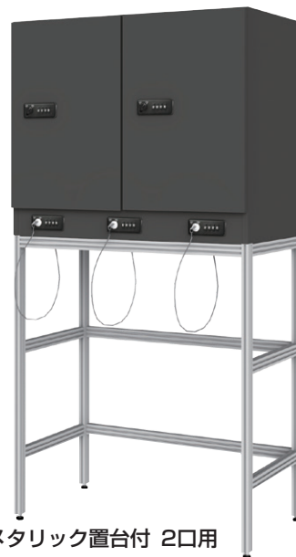
メタリック置台付 2口用