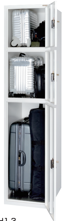
ESUH1-3 (スーツケースロッカー 1列3段 3口用)

横中仕切板差込構造、扉(補強付)、 ステンレス床板付 コインリターン(DRH)錠 ※掛け丁番・ボンデ鋼板仕様