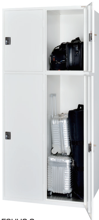
ESUH2-2 (スーツケースロッカー 2列2段 4口用)

サビに対して強いボンデ鋼板を使用し、 粉体塗装にて、より耐サビ効果の高い製品に仕上げています。