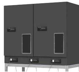
〔ポリカーボネート製窓付〕