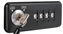
ゼロリセット錠 (ワイヤー施錠タイプ)