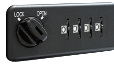
ゼロリセット錠 (通常タイプ)