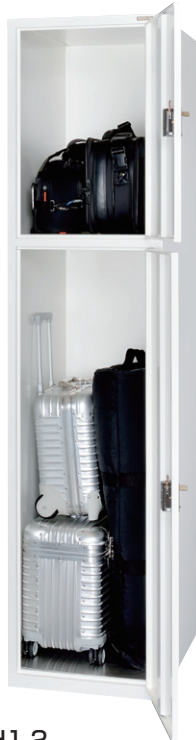
ESUH1-2 (スーツケースロッカー 1列2段 2口用)

横中仕切板差込構造、扉(補強付)、 ステンレス床板付 コインリターン(DRH)錠 ※掛け丁番・ボンデ鋼板仕様