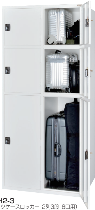
ESUH2-3 (スーツケースロッカー 2列3段 6口用)

H2000×W900×D700 内寸法：(上段)h381×w392.5×d680 (中段)h459×w392.5×d680 (下段)h979×w392.5×d680