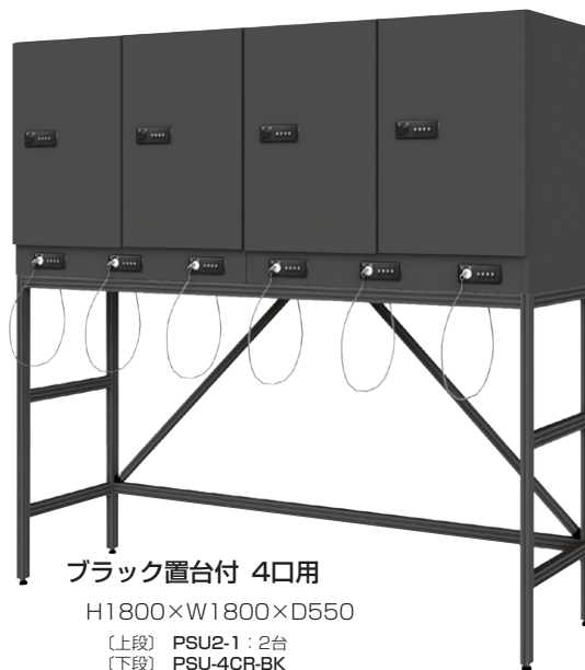
ブラック置台付 4口用