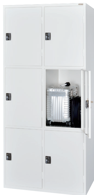
ESUK2-3 (スーツケースロッカー 2列3段 6口用)