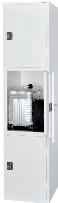
ESUK1-3 (スーツケースロッカー 1列3段 3口用)

横中仕切板差込構造、扉(補強付)、 ステンレス床板付 コインリターン(DRH)錠 ※掛け丁番・ボンデ鋼板仕様