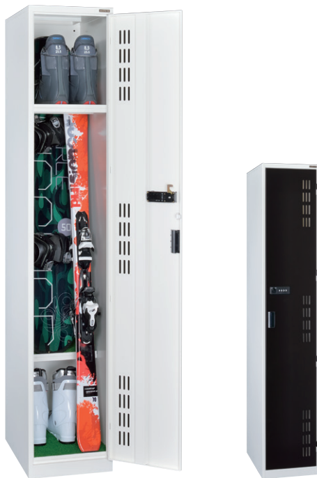
KBD-2 (スキー・スノーボードロッカー 2人用)

扉(補強付)、ゼロリセット錠、棚板[2]、マット敷、 天板通気口、アジャスター付 ※掛け丁番・ボンデ鋼板仕様