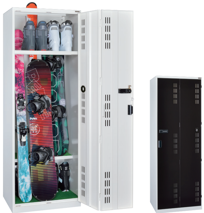
KBD-4 (スキー・スノーボードロッカー 4人用)