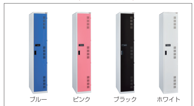
カラーバリエーション (KBD・KBPタイプ)