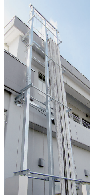
▲建物への直接取り付け