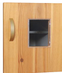
● ポリカーボネート窓付扉