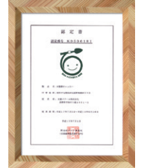
間伐材使用認定書

間伐材マーク 間伐材マークは、全国森林組合連合会に認定された製品に付けられます。