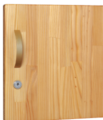
● シリンダー錠付扉