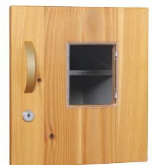
● シリンダー錠・ポリカーボネート窓付扉

※ 天然木を使用した商品は、カタログ掲載写真と色・柄が同じではありません、あらかじめご了承ください。